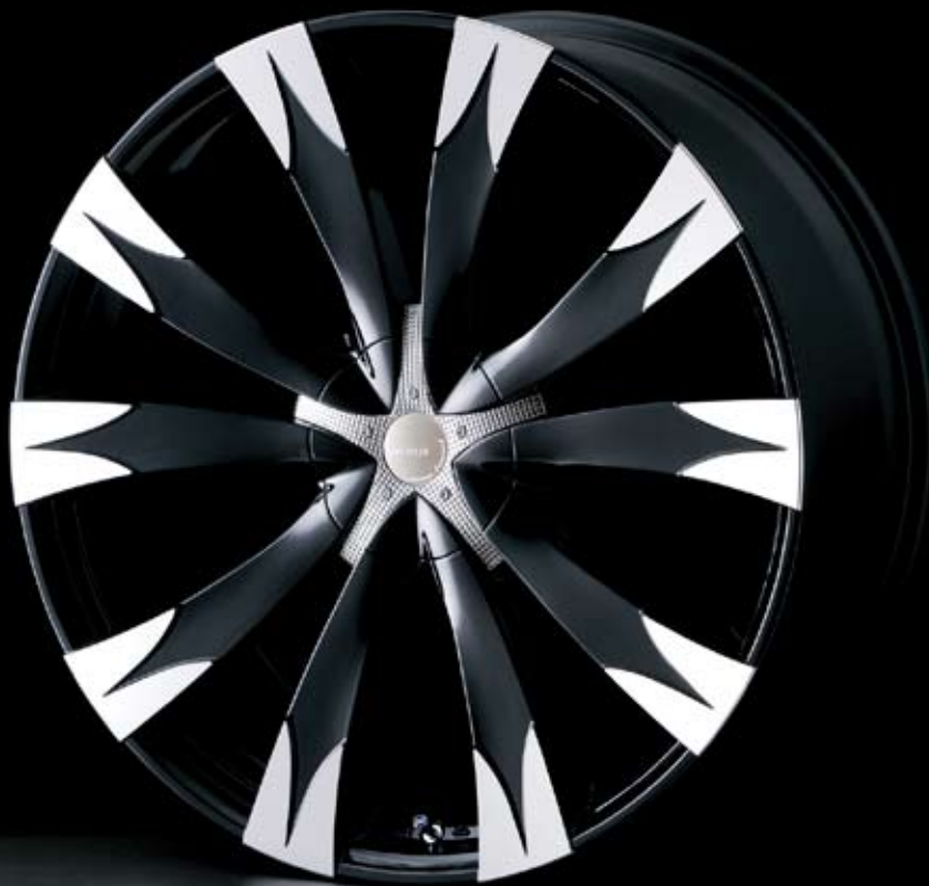
PHOTO : BLACK POLISH

華やかさを極めたブラックポリッシュなら、スポークが回転時やナイトシーンでブラックアウトされるため、センター部のダイヤプレートとスポーク先端部のレリーフカットの存在感がさらに強調。特に先端のレリーフが浮いて見えるため、視覚的なインチアップ効果にもつながります。グレーメタリックポリッシュなら落ち着いたオトナのオシャレが楽しめます。