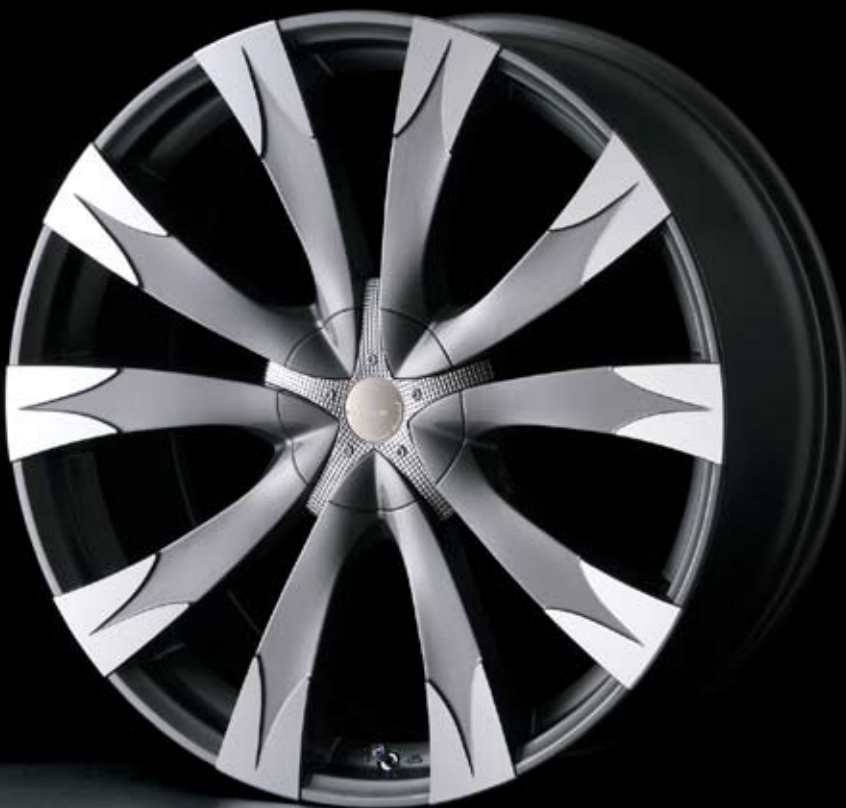
PHOTO : GRAY METALLIC POLISH

華やかさを極めたブラックポリッシュなら、スポークが回転時やナイトシーンでブラックアウトされるため、センター部のダイヤプレートとスポーク先端部のレリーフカットの存在感がさらに強調。特に先端のレリーフが浮いて見えるため、視覚的なインチアップ効果にもつながります。グレーメタリックポリッシュなら落ち着いたオトナのオシャレが楽しめます。